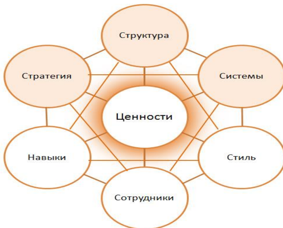
Рисунок А.1- Модель организации